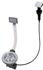
Vidange automatique - PM 8407 113