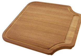
Planche de découpe en bois Iroko 8646 000

* uniquement en combinaison avec l'accessoire 8644 101